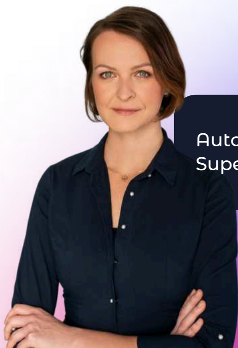
Autor: Vendula Střítecká Supervisor & Tax Consultant

Prvotní práce na zakázce byla náročná kvůli nutnosti rychlého přechodu na nový systém bez přerušení provozu, ale díky zkušenostem našeho týmu se podařilo přechod zvládnout plynule.